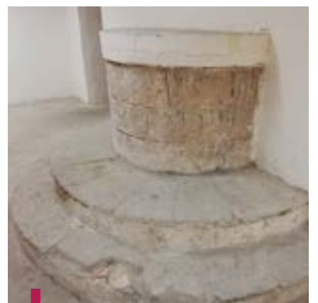
Το μισό πηγάδι στο υπόγειο του κτιρίου