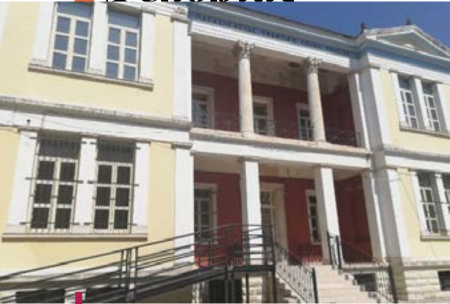
Η πρόσοψη της Παπαζόγλειου Σχολής, με τη ράμπα που είχε τοποθετηθεί για τα νήπια