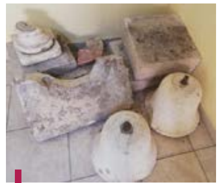
Τα διακοσμητικά στοιχεία που έχουν αποσπαστεί