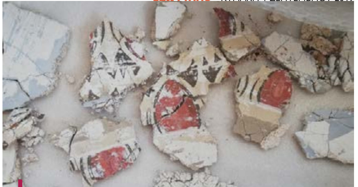
Ένα από τα μεγαλύτερα θραύσματα της οροφωγραφίας