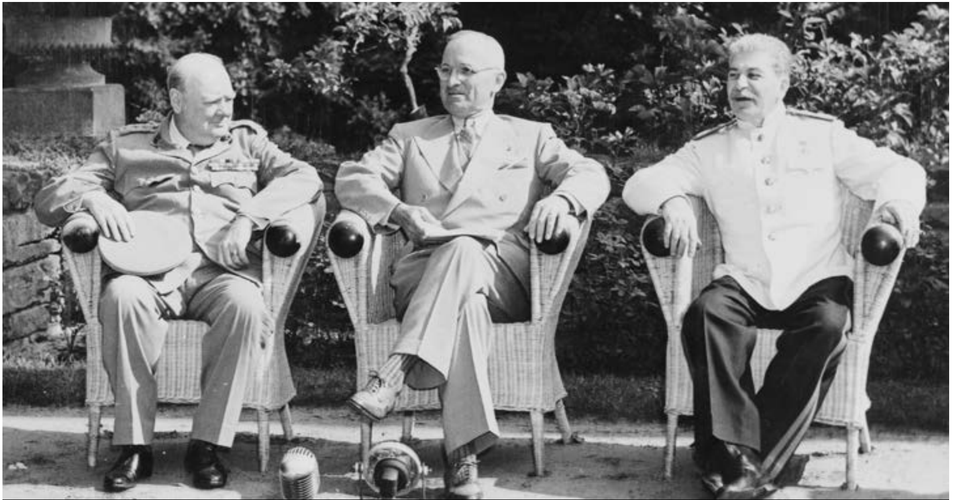
Ο Βρετανός πρωθυπουργός Ουίνστον Τσόρτσιλ, ο πρόεδρος των ΗΠΑμ Χάρι Σ. Τρούμαν και ο σοβιετικός ηγέτης Ιωσήφ Στάλιν στον κήπο του παλατιού Cecilienhof πριν συναντηθούν για τη Διάσκεψη του Πόττονταμ στο Πόττονταμ της Γερμανίας.