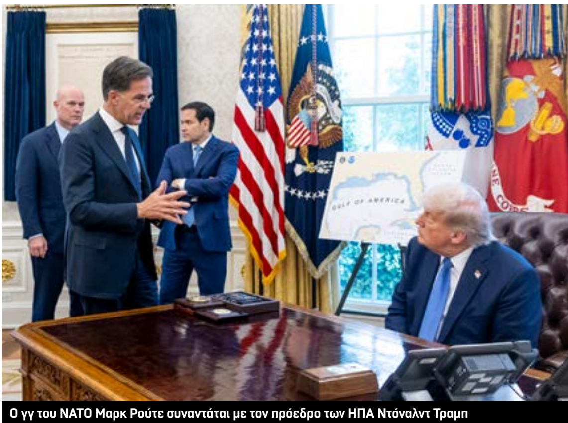
Ο γγ του NATO Μαρκ Ρούτε συναντάται με τον πρόεδρο των ΗΠΑ Ντόναλντ Τραμπ

Τι θα γίνει; 80 χρόνια από το τέλος του Β' Παγκοσμίου Πολέμου, μια ισχυρότερη Ευρώπη θα αποτελέσει την αντικατάσταση των ΗΠΑ στις οποίες δεν μπορεί πλέον να βασιστεί κανείς; Ή θα υπάρξει μια νέα συμμαχία με την Ουάσινγκτον; Σε αυτό το ερώτημα θα πρέπει να απαντήσει η νέα γερμανική κυβέρνηση.