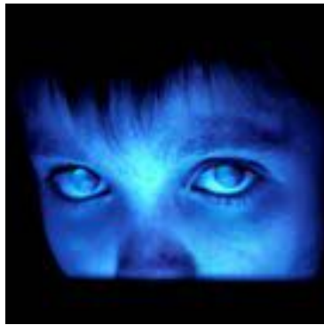
Porcupine Tree Fear of a Blank Planet

Το πρωτόκουσα μόλις κυκλοφόρησε το 2002 και έπαθα σοκ. Είχα ήδη λιώσει τα Surfing with the Alien και Flying in a blue dream, αλλά αυτός ο δίσκος ήταν τόσο φρέσκος, τόσο μελωδικά ανεβαστικός, με όλα τα τραγούδια να είναι ένα και ένα. Η παραγωγή του είναι φανταστική, ακόμα και τώρα όταν ακούω το album αυτό με εντυπωσιάζει κάθε φορά. Εννοείται ότι είχα μάθει να τραγουδάω όλες τις μελωδίες και τα solos απέξω, τα θυμάμαι ακόμα. Το αποκορύφωμα ήταν όταν είδα το Satriani την ίδια χρονιά στο θέατρο Πέτρας, όπου τον παρουσίασε ζωντανά. Για μένα το Strange Beautiful Music είναι ο απόλυτος και ο σπουδαιότερος κιθαριστικός δίσκος όλων των εποχών.