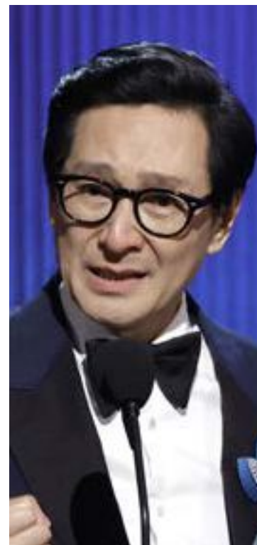
Ke Huy Quan

«Η υποκριτική ξανά - είναι τόσο διασκεδαστικό. Εμπλουτίζει τη ζωή σου», δήλωσε στο People . «[Η Τζέσικα Τάντι] κέρδισε ένα Όσκαρ όταν ήταν 80 ετών. Μπορώ ακόμα να κερδίσω», αστειεύτηκε. Δυστυχώς, δεν της δόθηκε η ευκαιρία.