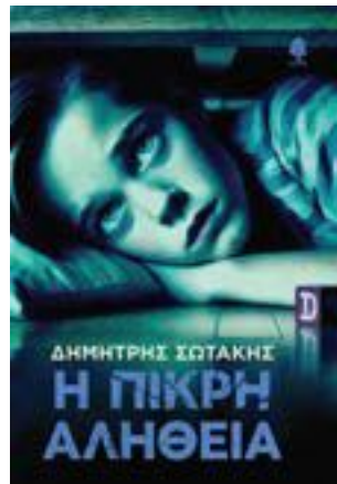
Η ΠΙΚΡΗ ΑΛΗΘΕΙΑ ΔΗΜΗΤΡΗΣ ΣΩΤΑΚΗΣ ΕΚΔΟΣΕΙΣ ΚΕΔΡΟΣ

Τ α θέματα στα οποία παραπέμπει το φανταστικό σύμπαν του Δημήτρη Σωτάκη είναι ποικίλα: από τις απώλειες του έρωτα, της μοναξιάς και του θανάτου και το αδιευκρίνιστο, μονίμως διαφιλονικούμενο παρελθόν μέχρι τις κοινωνίες που εξαφανίζουν το άτομο και την ιδιοσυστασία του με τους εξοντωτικούς ρυθμούς εργασίας τους οποίους επιβάλλουν και με την υπερπαραγωγή των προϊόντων τους. Προσπαθώντας το άτομο να ανταποκριθεί σε απαιτήσεις που ξεπερνούν το μέτρο του, θα στερηθεί τις πραγματικές του επιθυμίες, υποχωρώντας στο εσωτερικό μιας ζώνης, η οποία έχει καταπλακωθεί από την ομοιομορφία και την έλλειψη ταυτότητας ή διαφοράς.