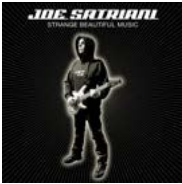
Joe Satriani Strange Beautiful Music

Το πρωτόκουσα μόλις κυκλοφόρησε το 2002 και έπαθα σοκ. Είχα ήδη λιώσει τα Surfing with the Alien και Flying in a blue dream, αλλά αυτός ο δίσκος ήταν τόσο φρέσκος, τόσο μελωδικά ανεβαστικός, με όλα τα τραγούδια να είναι ένα και ένα. Η παραγωγή του είναι φανταστική, ακόμα και τώρα όταν ακούω το album αυτό με εντυπωσιάζει κάθε φορά. Εννοείται ότι είχα μάθει να τραγουδάω όλες τις μελωδίες και τα solos απέξω, τα θυμάμαι ακόμα. Το αποκορύφωμα ήταν όταν είδα το Satriani την ίδια χρονιά στο θέατρο Πέτρας, όπου τον παρουσίασε ζωντανά. Για μένα το Strange Beautiful Music είναι ο απόλυτος και ο σπουδαιότερος κιθαριστικός δίσκος όλων των εποχών.