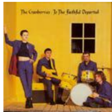
The Cranberries To The Faithful Departed

Κάπου μεταξύ Αρχαίων και Μαθηματικών στο Γυμνάσιο ένας φίλος άκουγε ένα CD με ένα περίεργο εξώφυλλο το οποίο φυσικά έκανε εμένα ακόμη πιο περίεργο. Φυσικά το πρώτο κομμάτι που μου έβαλε να ακούσω ήταν το Self Esteem. Ακόμη θυμάμαι το συναίσθημα του να ακούς κάτι για πρώτη φορά και απλά να σε αγγίζει τόσο πολύ.