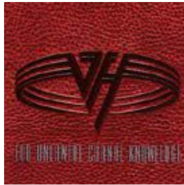
Van Halen For Unlawful Carnal Knowledge

Είναι ο δίσκος που θα έπαιρνα μαζί μου σε ένα έρημο νησί χωρίς δεύτερη σκέψη. Η αισθητική, τα layers του ήχου, η δυναμικές και τα visuals είναι καθηλωτικά από αυτή τη μπάντα σε αυτή όπως και σε όλες τις κυκλοφορίες τους. Έχω δει συνολικά live και τους Porcupine Tree και το Steven Wilson solo 4 φορές και κάθε φορά είναι μια μοναδική εμπειρία. Το συγκεκριμένο album είναι επίσης από τις αγαπημένες μου παραγωγές και με έχει επηρεάσει πάρα πολύ στο δικό μου songwriting.