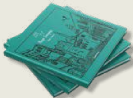
«25+1 ΡΕΤΡΟ ΙΣΤΟΡΙΕΣ»