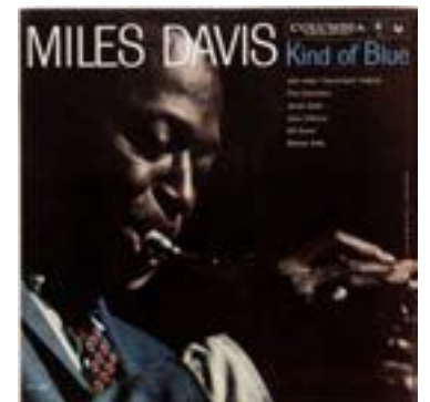
Miles Davis Kind Of Blue

Τους Cranberries τους ανακάλυψα από τον καθηγητή μου των drums. Ο συνδυασμός της φωνής της Dolores O'Riordan με τις σκοτεινές μελωδίες του δίσκου θεωρώ ακόμα και μετά από σχεδόν 30 χρόνια ότι είναι από τα πιο ιδιαίτερα albums που βγήκαν ποτέ.