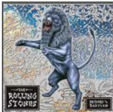
Rolling Stones Bridges To Babylon

Αν και είναι 2 ξεχωριστά αλλά δεδομένα ότι είναι του ίδιου συγκροτήματος θα τα βάλω μαζί. Ο λόγος απλός, το Load ήταν το πρώτο album που αγόρασα σε ηλικία 11 ετών. Virgin Megastores στην Σταδίου, όπου μπορούσες να ακούσεις τα album μέσα στο δισκοπωλείο με τα ογκώδη ακουστικά και πατούσες το τεράστιο κόκκινο κουμπί για να πας στο επόμενο track. Το Black Album δεν θεωρώ ότι χρειάζεται ιδιαίτερη επεξήγηση καθώς είναι ένα iconic album όπου κατάφερε για το genre της metal να μπει στις πρώτες θέσεις των charts. Δεν είναι τυχαίο ότι 35 χρόνια μετά την κυκλοφορία του πουλάει ακόμα κατά μέσο όρο 20.000 αντίτυπα τον μήνα.