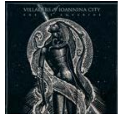
Villagers of Ioannina City Age of Aquarius

Αυτό είναι πρώτο album που με έβαλε στο progressive rock/metal. Τυχαία αγόρασα το δίσκο γιατί μου άρεσε τρομερά το εξώφυλλο. Την πρώτη φορά που τον άκουσα ένιωσα πρώτα από όλα έκπληξη και σχεδόν δυσπιστία. Δεν περίμενα καθόλου για παράδειγμα να ακούσω sólo σαξόφωνο σε metal δίσκο, ούτε μπαλάντα με rock ανθεμικές στιγμές, κι όλα αυτά σε συνδυασμό με εκπληκτικές κιθάρες και τύμπανα με ασύμμετρους ρυθμούς και υπερ-τεχνικά σημεία. Οι Theater συνδυάζουν σε αυτό το δίσκο όλα τα επιθετικά στοιχεία που λατρεύω στο metal μαζί με κάποιες, αν θες, έντονες απολαύσεις από άλλα μουσικά είδη. Όλο αυτό λειτούργησε άκρω εμπνευστικά και απελευθερωτικά για μένα στον τρόπο που γράφω η ίδια.