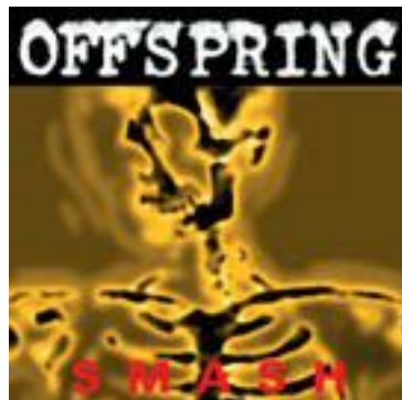
The Offspring Smash

Από τις πλέον αξέχαστες συναυλίες των Rolling Stones στην Ελλάδα, εκτός του ότι ήταν η πρώτη μου στην ηλικία των 13 ετών, το Bridges to Babylon Tour είχε αφήσει ένα ξεχωριστό σημάδι στην ιστορία των συναυλιών λόγω του μεγέθους της παραγωγής καθώς ήταν η μοναδική συναυλία η οποία μπορούσε να συγκριθεί με το υπερθέαμα των Pink Floyd. Κάπως έτσι είχα φτάσει να λιώνω το CD πηγαίνοντας και γυρίζοντας στο σχολείο.