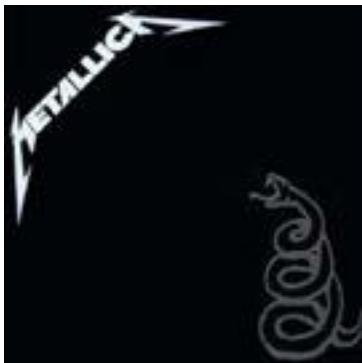
Load & Metallica (The Black Album)

Άλλος ένας λόγος να αγαπάω τα Γιάννενα! Οι Villagers είναι μια μπάντα με δύναμη, ατόφιο τρόπο γραφής και απίστευτη ζωντανή παρουσία. Οι συναυλίες τους έχουν ένα μυστικιστικό χαρακτήρα, σαν τελετή μύησης σε κάτι το κοσμικό και βαθιά υπαρξιακό. Η ατμόσφαιρα αυτή αποτυπώνεται απόλυτα στο συγκεκριμένο δίσκο, ο οποίος είναι κορυφαίος στο σύνολό του με ενορχηστρώσεις και φωνητικά που σε χτυπάνε στην καρδιά. Το ομώνυμο κομμάτι αλλά και το Cosmic soul είναι από τα πιο ανατριχιαστικά κομμάτια που έχω ακούσει γενικώς.