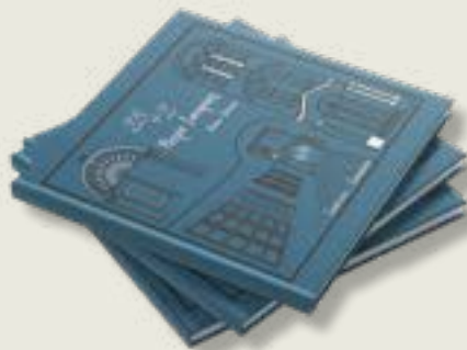
«25+2 ΡΕΤΡΟ ΙΣΤΟΡΙΕΣ»