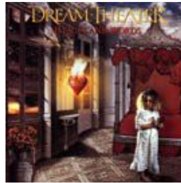
Dream Theater Images and Words

Λατρεύω τους Van Halen και ειδικά με το Sammy Hagar, και αυτός ο δίσκος είναι για μένα η κορυφαία τους στιγμή όσον αφορά το songwriting και τον ήχο της μπάντας. Έχει μέσα τα περισσότερα αγαπημένα μου κομμάτια τους, όπως Judgement Day, The Dream is Over, In 'n' Out, Pleasure Dome. Εντωμεταξύ απολαμβάνω να τα ακούω τόσο σαν κομμάτια όσο από κιθαριστικής άποψης - για μένα ο δίσκος αυτός έχει τα πιο κορυφαία και εντυπωσιακά licks του Eddie! Σαν κιθαρίστας με έχει επηρεάσει και συγκινήσει τόσο πολύ με το παίξιμο, τον ήχο και το όλο performance του. Με τη συγκίνηση που ένιωθα και μόνο από τα live βίντεο των Van Halen, ειλικρινά δεν μπορώ να φανταστώ πώς θα ήταν να τους είχα δει ζωντανά!