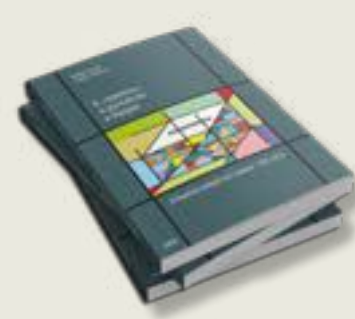
«ΟΙ 'ΑΠΟΣΤΑΤΕΣ' ΤΑ ΡΕΝΤΖΕΛΑ ΚΑΙ ΟΙ ΔΗΜΑΡΧΟΙ»