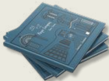
«25+2 ΡΕΤΡΟ ΙΣΤΟΡΙΕΣ»