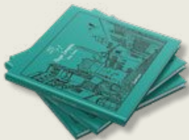
«25+1 ΡΕΤΡΟ ΙΣΤΟΡΙΕΣ»