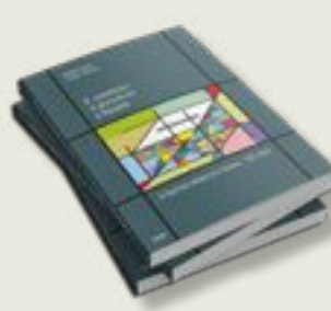
«ΟΙ 'ΑΠΟΣΤΑΤΕΣ' ΤΑ ΡΕΝΤΖΕΛΑ ΚΑΙ ΟΙ ΔΗΜΑΡΧΟΙ»