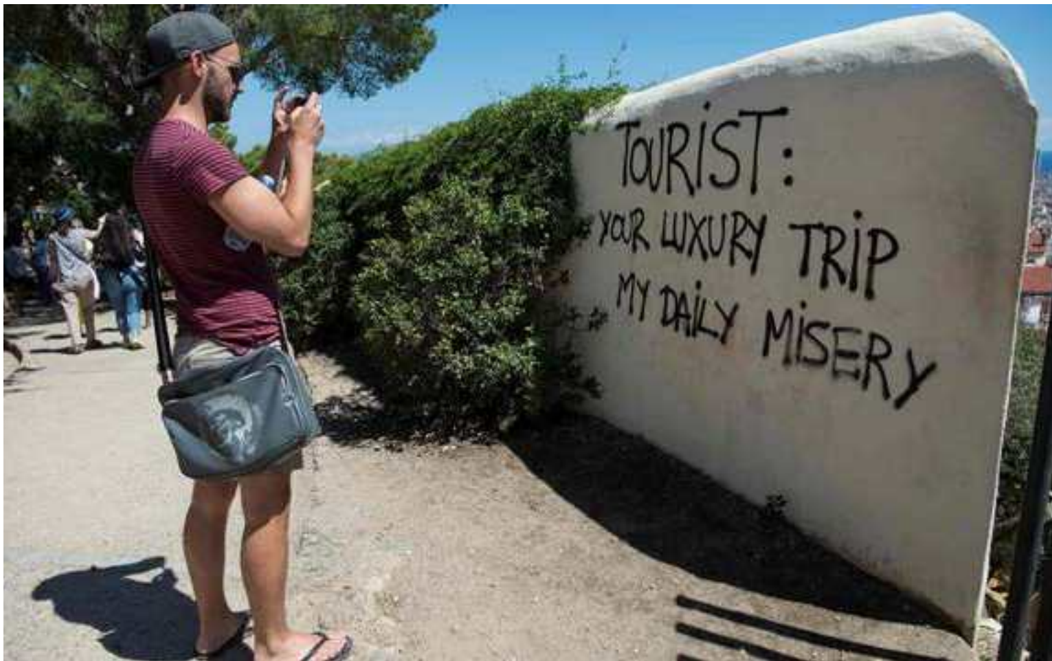
Το γκράφιτι στο πάρκο Güell στη Βαρκελώνη αντικατοπτρίζει τα αισθήματα των ντόπιων για τον υπερβολικό αριθμό τουριστών στην πόλη.

Ε νώ η πανδημία του Covid-19 προσέφερε μια ευπρόσδεκτη ανάπαυλα σε πολλούς ντόπιους από τις ορδές των ταξιδιωτών που πετούν, οι ενοχλητικοί τουρίστες τους σπάνε και πάλι τα νεύρα. Σε τέτοιο βαθμό, που ντόπιοι και ακτιβιστές έχουν βγει στους δρόμους σε διάφορες πόλεις της Ισπανίας, της Ιταλίας, της Πορτογαλίας και της Ελλάδας, ορισμένοι οπλισμένοι με νεροπίστολα και αυτοκόλλητα που λένε στους θορυβώδεις επισκέπτες να πάνε στα σπίτια τους.