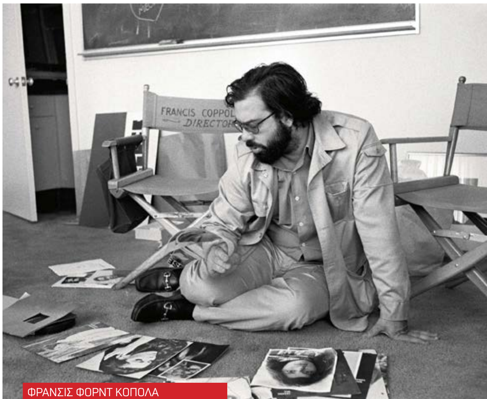
ΦΡΑΝΣΙΣ ΦΟΡΝΤ ΚΟΠΟΛΑ

Η γενιά του Νέου Χόλιγουντ, η οποία έφερε επανάσταση στην έβδομη τέχνη τη δεκαετία του 1970, δεν αντιμετώπισε το ίδιο πρόβλημα. Ο Σκορσέζε, ο Άλεν, ο Κόπολα, ο Ντε Πάλμα, ο Μάλικ και ο Σρέιντερ απολαμβάνουν ακόμη το σπάνιο προνόμιο να συνεχίζουν να γυρίζουν ταινίες σε πολύ προχωρημένη ηλικία. Κάποιοι από αυτούς, αν το επιτρέψουν οι βιολογικές ανάγκες, θα μπορούσαν να καταρρίψουν το ρεκόρ δημιουργικής μακροζωίας του Πορτογάλου σκηνοθέτη Μανουέλ ντε Ολιβέιρα, ο οποίος ανακοίνωσε ότι παίρνει άδεια σε ηλικία 101 ετών, μετά την κυκλοφορία της ταινίας Η παράξενη υπόθεση της Angelica (2010), και είχε ακόμα χρόνο να ξαναπιάσει το κλαπέτο και να σκηνοθετήσει μερικές ακόμα ταινίες. Το πρόβλημα που αντιμετωπίζει η νέα φουρνιά των εβδομνητάρηδων και ογδοντάρηδων στο Χόλιγουντ είναι ότι οι ταινίες τους φαίνεται να προκαλούν φθίνοντα ενθουσιασμό τόσο στο κοινό της γενιάς Z όσο και στους ιεράρχες της βιομηχανίας. Ο Κόπολα ήταν ο τελευταίος που αντιμετώπισε εμπόδια που θα μπορούσαν να εκτροχιάσουν την καριέρα του. Η Megalopolis , η πρώτη του ταινία μετά από 13 χρόνια (μετά την αποτυχία του Twixt , ενός εκτός κλίματος, βουβού Κόπολα), άργησε να βρει διανομή στην Ευρώπη και ακόμη δεν έχει βρει στις Η.Π.Α.