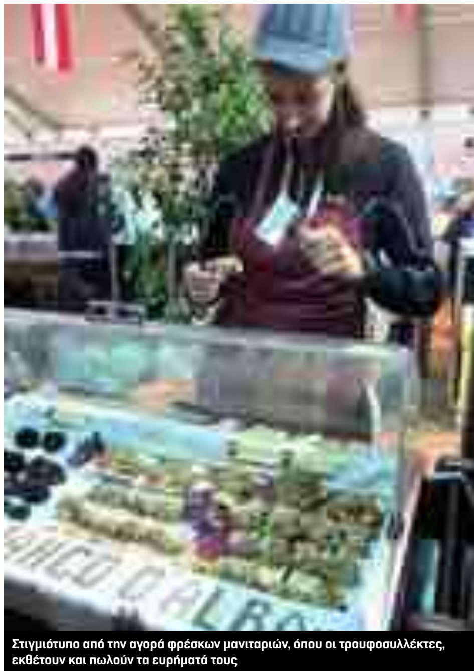
Στιγμιότυπο από την αγορά φρέσκων μανιταριών, όπου οι τρουφοσυλλέκτες, εκθέτουν και πωλούν τα ευρήματά τους

Η ετήσια διεθνής έκθεση Fiera Nazionale Tartufo Bianco d' Alba, καθιερωμένη το 1928 και προγραμματισμένη να συμπίπτει με την περίοδο της συγκομιδής (ανοίξτε και το https://www.fieradeltartufo.org/en/ ) θα διαρκέσει φέτος μέχρι τις 3 Δεκεμβρίου.