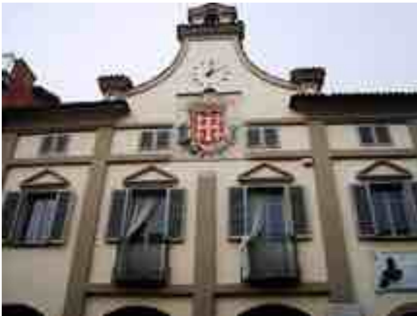
Η πόλη Νιέβε συμπεριλαμβάνεται στη λίστα των ομορφότερων χωριών της Ιταλίας. Κάτω οι κοκκινοκίτρινοι αμπελώνες, καθώς ξεπροβάλλουν μέσα στην πρωινή ομίχλη