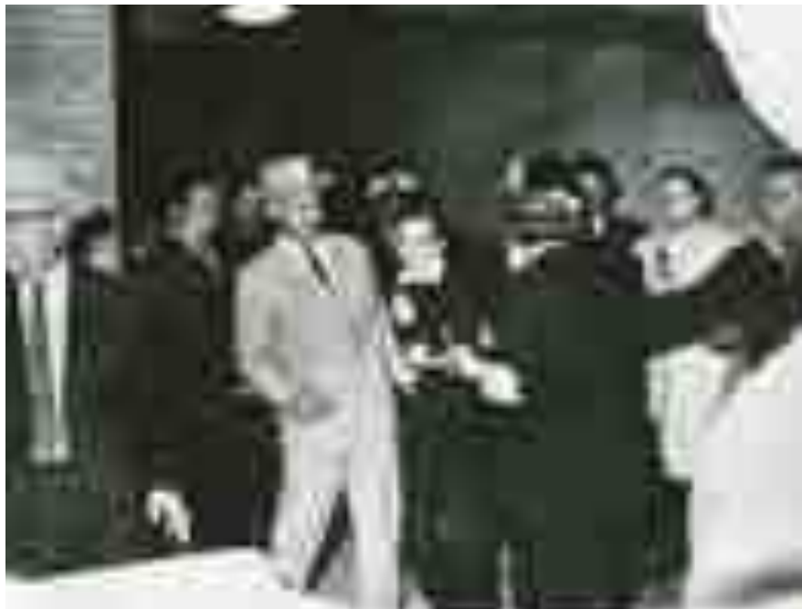
Αριστερά ο Πολ Λάντις. Πάνω ο Λι Χάρβεϊ Όσβαλντ τη στιγμή που δέχεται τα πυρά του ιδιοκτήτη νυχτερινών κέντρων, Τζακ Ρούμπι, σε διάδρομο του αρχηγείου της αστυνομίας του Ντάλας.

Τον περασμένο Σεπτέμβριο, οι New York Times επικεντρώθηκαν στην αφήγηση του Πολ Λάντις, ενός από τους πράκτορες των μυστικών υπηρεσιών που βρισκόταν λίγα μέτρα μακριά από τον Κένεντι όταν τον πυροβόλησαν. Η μαρτυρία του Λάντις, η οποία περιλαμβάνεται σε επικείμενα απομνημονεύματά του, αμφισβητεί τη «θεωρία της μίας σφαίρας» της Επιτροπής Γουόρεν, σύμφωνα με την οποία μία από τις τρεις σφαίρες διαπέρασε τον λαιμό του Κένεντι προτού χτυπήσει τον κυβερνήτη του Τέξας Τζον Μπ. Κόνελι που καθόταν στο μπροστινό κάθισμα, τραυματίζοντας την πλάτη, το στήθος, τον καρπό και τον