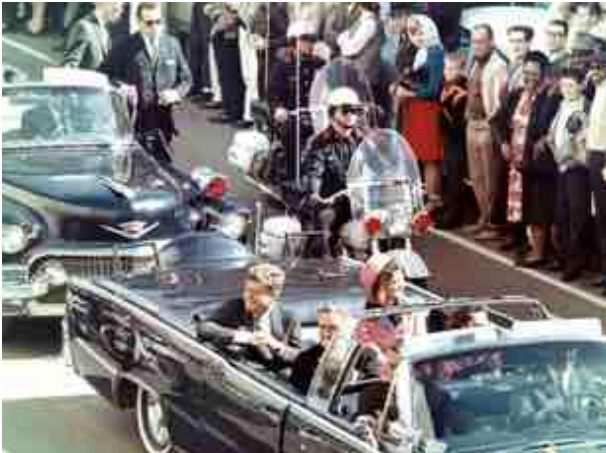
Ο πρόεδρος Κένεντι στη λιμουζίνα του στο Ντάλας του Τέξας, στην οδό Main Street, λίγα λεπτά πριν από τη δολοφονία. Στην προεδρική λιμουζίνα βρίσκονται επίσης η Τζάκι Κένεντι, ο κυβερνήτης του Τέξας Τζον Κόναλι και η σύζυγός του, Νέλι

Από το «JFK» του Όλιβερ Στόουν μέχρι το επερχόμενο «Assassination», σκηνοθέτες και συγγραφείς προσπαθούν εδώ και καιρό να αποκαλύψουν την αλήθεια πίσω από τη δολοφονία του Τζον Κένεντι.