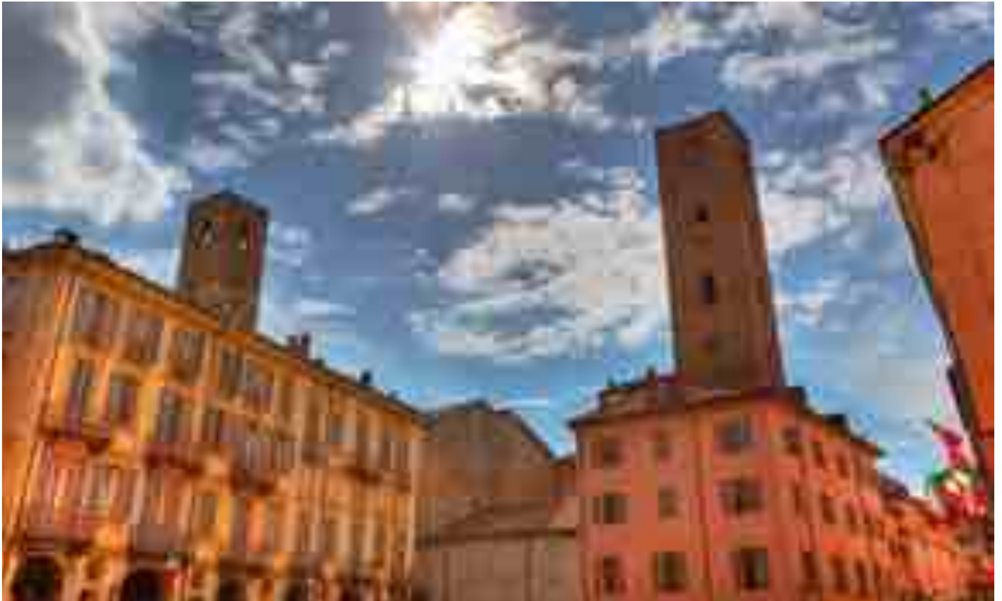
Άποψη της κεντρικής πλατείας της Άλμπα - διάσημη για τις γιορτές λευκής τρούφας και την παραγωγή κρασιού