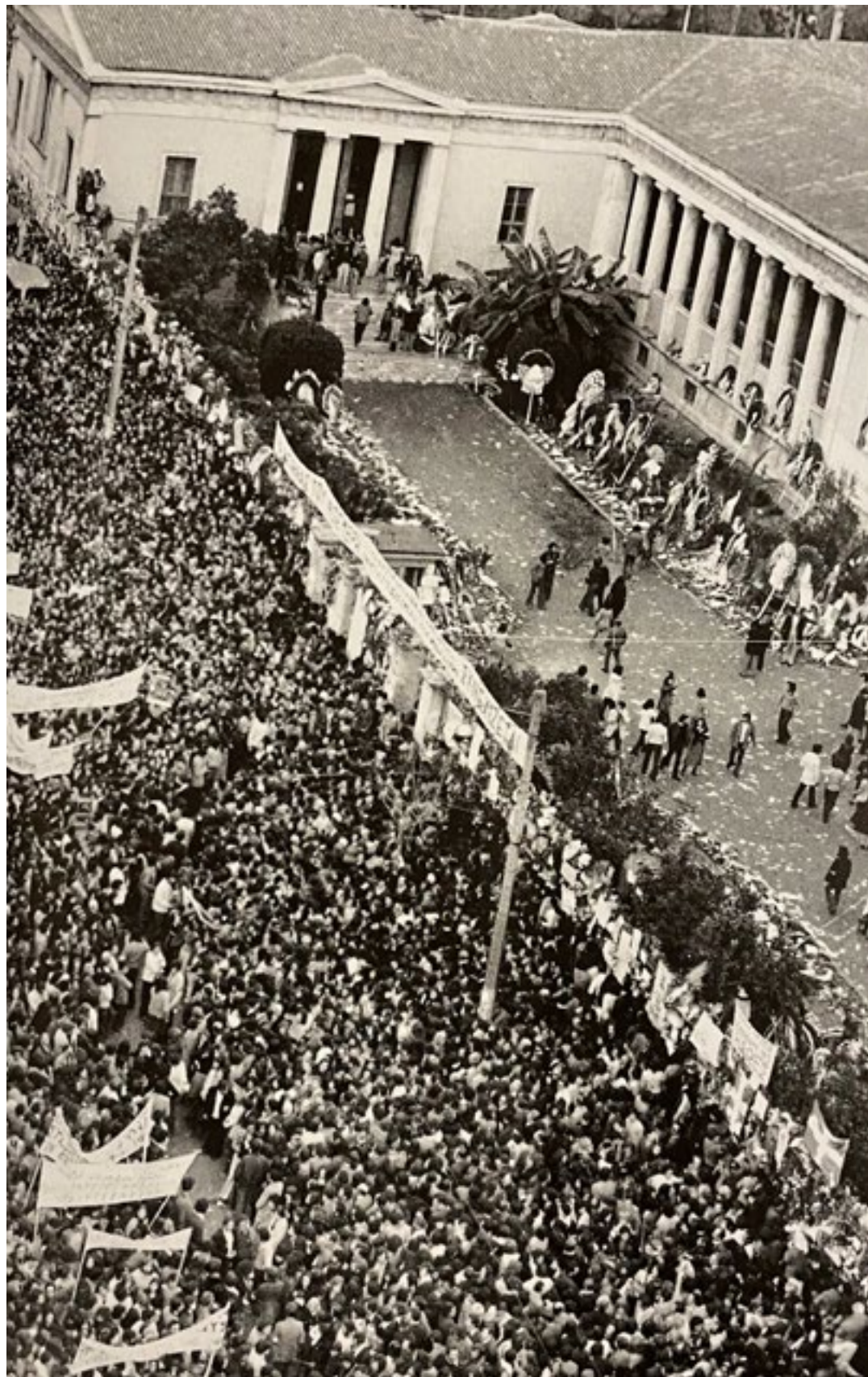
ΙΣΤΟΡΙΚΟ ΛΕΥΚΩΜΑ 1974/Η ΚΑΘΗΜΕΡΙΝΗ