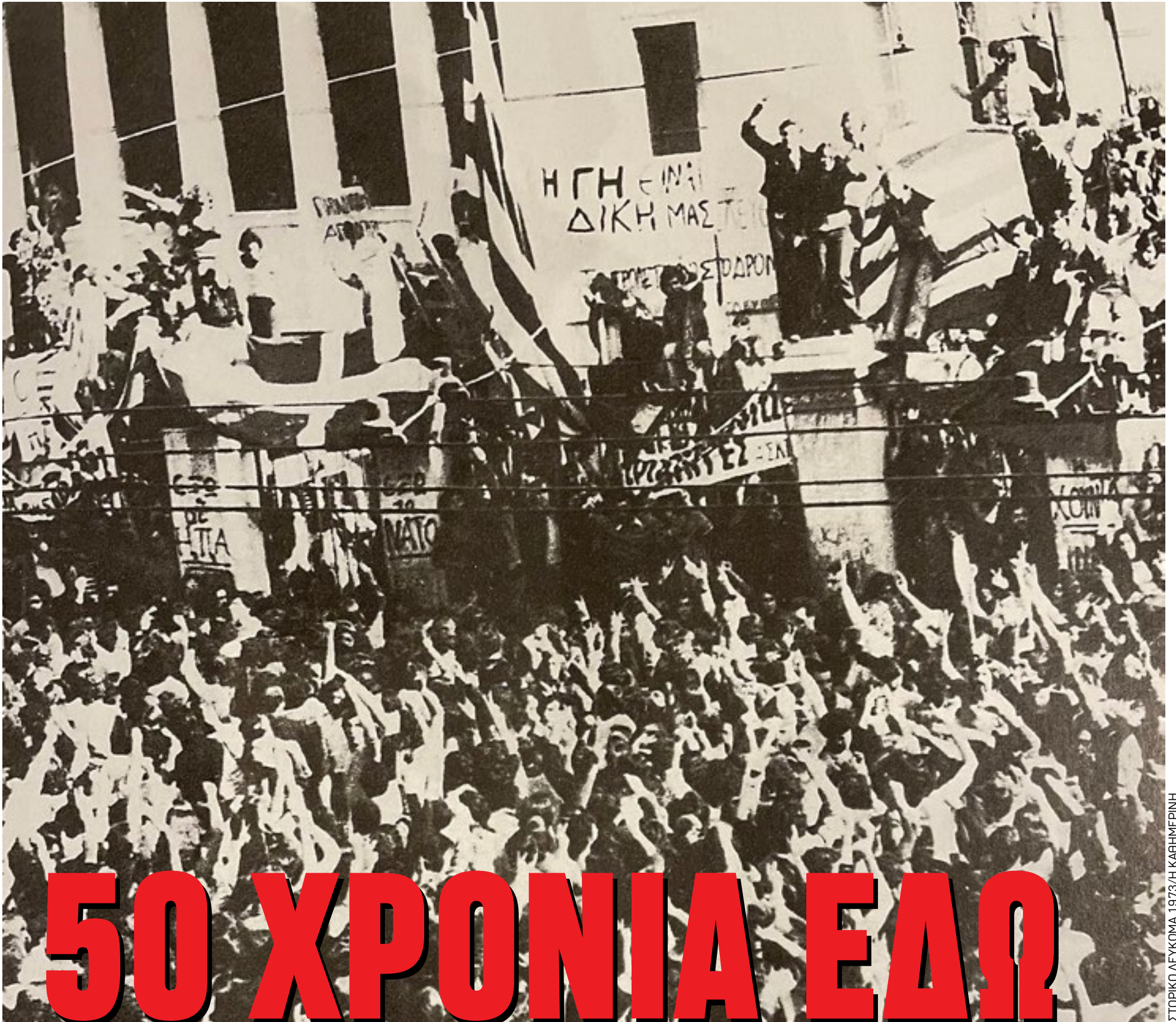
ΙΣΤΟΡΙΚΟ ΛΕΥΚΩΜΑ 1973/Η ΚΑΘΗΜΕΡΙΝΗ

Η ΨΗΦΙΑΚΗ ΕΦΗΜΕΡΙΔΑ ΤΟΥ ΤΥΠΟΥ ΙΩΑΝΝΙΝΩΝ ▪ ΠΑΡΑΣΚΕΥΗ 17 ΝΟΕΜΒΡΙΟΥ 2023 ▪ ΤΕΥΧΟΣ #275