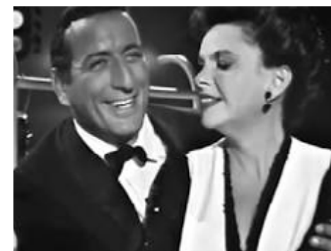
I Left My Heart in San Francisco με τη Τζούντι Γκάρλαντ

Μόνο ένα ταλέντο όπως η Τζούντι Γκάρλαντ μπορεί να αναζωογονήσει αυτό που θα γινόταν σίμα κατατεθέν της καριέρας του Μπένετ. Μέχρι τη στιγμή που οι δύο τους ένωσαν τις δυνάμεις τους στο I Left My Heart in San Francisco για ένα επεισόδιο του 1963 του The Judy Garland Show, το τραγούδι είχε ήδη γίνει επιτυχία. «Ένα από τα καλύτερα κομπλιμέντα που έλαβα ποτέ ήταν από τη Judy», έγραψε ο Μπένετ στο βιβλίο του Life is a Gift του 2012. «Είπε ότι ήμουν η επιτομή αυτού για το οποίο οι διασκεδαστές έχουν έρθει στη γη».