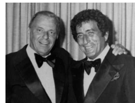
New York, New York με τον Φρανκ Σινάτρα

Μόνο ένα ταλέντο όπως η Τζούντι Γκάρλαντ μπορεί να αναζωογονήσει αυτό που θα γινόταν σίμα κατατεθέν της καριέρας του Μπένετ. Μέχρι τη στιγμή που οι δύο τους ένωσαν τις δυνάμεις τους στο I Left My Heart in San Francisco για ένα επεισόδιο του 1963 του The Judy Garland Show, το τραγούδι είχε ήδη γίνει επιτυχία. «Ένα από τα καλύτερα κομπλιμέντα που έλαβα ποτέ ήταν από τη Judy», έγραψε ο Μπένετ στο βιβλίο του Life is a Gift του 2012. «Είπε ότι ήμουν η επιτομή αυτού για το οποίο οι διασκεδαστές έχουν έρθει στη γη».