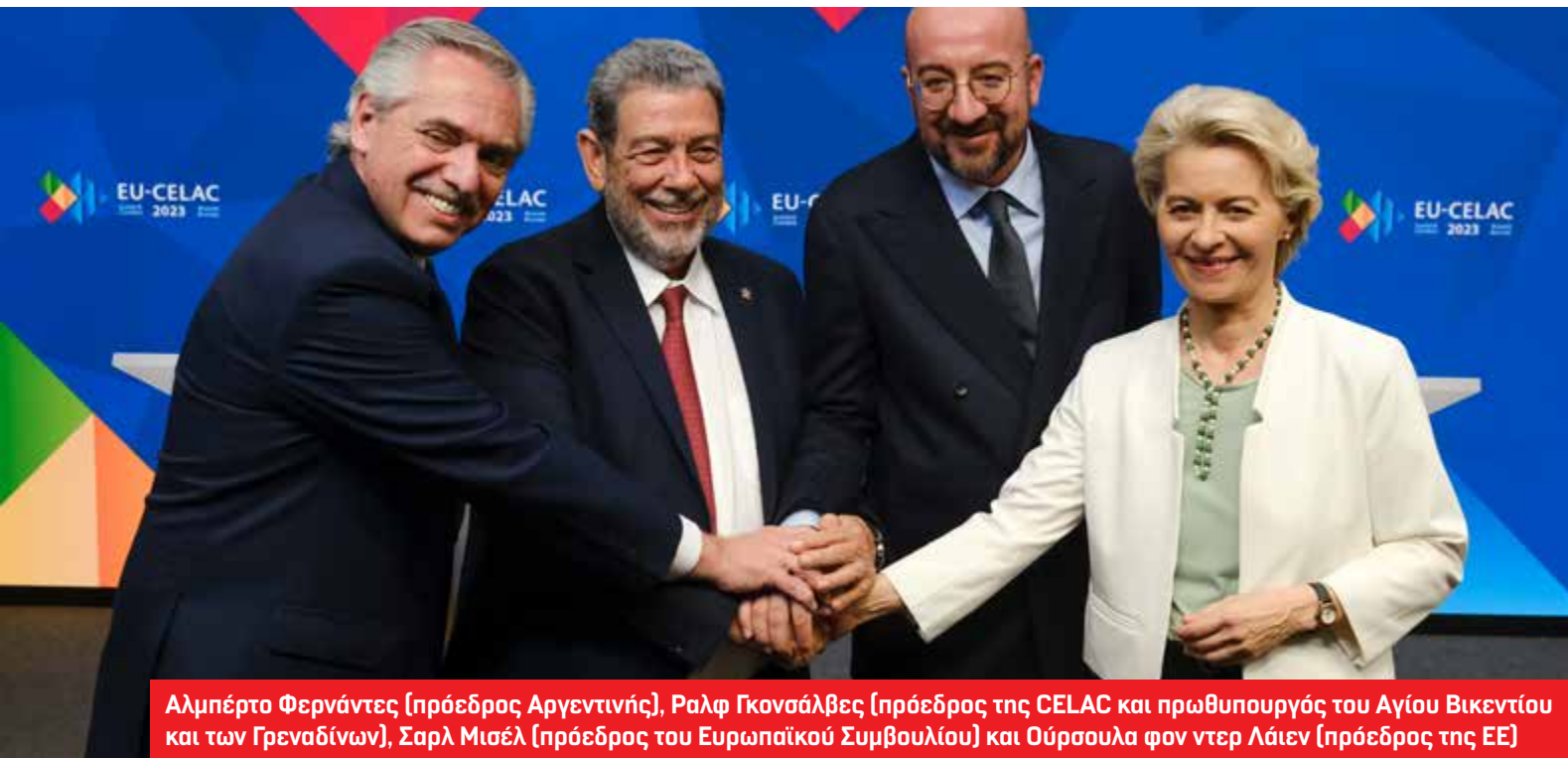
Αλμπέρτο Φερνάντες (πρόεδρος Αργεντινής), Ραλφ Γκονσάλβες (πρόεδρος της CELAC και πρωθυπουργός του Αγίου Βικεντίου και των Γρεναδίνων), Σαρλ Μισέλ (πρόεδρος του Ευρωπαϊκού Συμβουλίου) και Ούρσουλα φον ντερ Λάιεν (πρόεδρος της ΕΕ)

Η Ευρωπαϊκή Ένωση (ΕΕ) είχε πολλά κίνητρα για να διασφαλίσει την επιτυχία της συνόδου κορυφής με την CELAC (Κοινότητα των Κρατών της Λατινικής Αμερικής και της Καραϊβικής), η οποία ξεκίνησε ως διακυβερνητικός μηχανισμός το 1999.