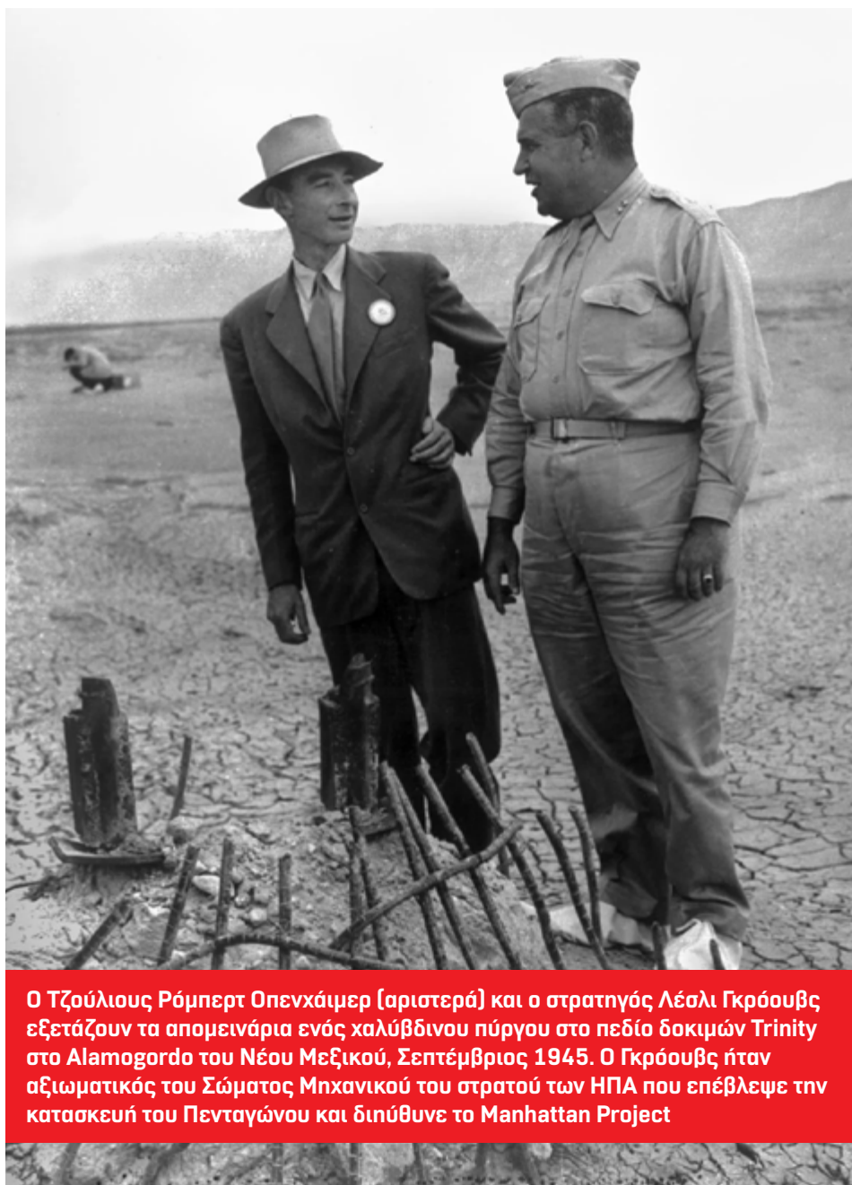
Ο Τζούλιους Ρόμπερτ Οπενχάιμερ (αριστερά) και ο στρατηγός Λέσλι Γκρόουβς εξετάζουν τα απομεινάρια ενός χαλύβδινου πύργου στο πεδίο δοκιμών Trinity στο Alamogordo του Νέου Μεξικού, Σεπτέμβριος 1945. Ο Γκρόουβς ήταν αξιωματικός του Σώματος Μηχανικού του στρατού των ΗΠΑ που επέβλεψε την κατασκευή του Πενταγώνου και διύθυνε το Manhattan Project

Οι κυβερνητικοί αξιωματούχοι επέλεξαν το Trinity Test Site επειδή ήταν απομακρυσμένο, επίπεδο και είχε προβλέψιμους ανέμους. Λόγω του μυστικού χαρακτήρα του έργου, οι κάτοικοι των γύρω περιοχών δεν είχαν προειδοποιηθεί. Στη λεκάνη Tularosa ζούσε πληθυσμός που ζούσε από τη γη, εκτρέφοντας ζώα και φροντίζοντας κήπους και αγροκτήματα. Αντλούσαν νερό από δεξαμενές και λίμνες. Δεν είχαν ιδέα ότι η λεπτή στάχτη που κατακάθισε στα πάντα τις ημέρες που ακολούθησαν την έκρηξη προερχόταν από την πρώτη ατομική έκρηξη στον κόσμο. Η κυβέρνηση προσπάθησε αρχικά να το αποκρύψει, λέγοντας ότι μια έκρηξη σε μια αποθήκη πυρομαχικών προκάλεσε τον θόρυβο και το έντονο φως, το οποίο μπορούσε να φανεί σε απόσταση μεγαλύτερη από 257 χιλιόμετρα. Μόνο όταν οι ΗΠΑ έριξαν βόμβες στην Ιαπωνία εβδομάδες αργότερα, οι κάτοικοι του Νέου Μεξικού συνειδητοποίησαν τι