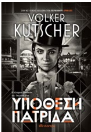
ΥΠΟΘΕΣΗ ΠΑΤΡΙΔΑ ΦΟΛΚΕΡ ΚΟΥΤΣΕΡ ΕΚΔΟΣΕΙΣ ΔΙΟΠΤΡΑ