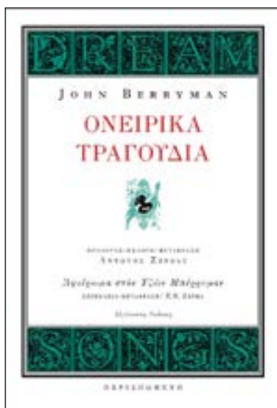
ΟΝΕΙΡΙΚΑ ΤΡΑΓΟΥΔΙΑ ΤΖΩΝ ΜΠΕΡΡΥΜΑΝ Μετάφραση: ΑΝΤΩΝΗΣ ΖΕΡΒΑΣ Εκδόσεις ΠΕΡΙΣΠΩΜΕΝΗ

Μ ε αφορμή την Παγκόσμια Ημέρα Ποίησης, τη Δευτέρα 21 Μαρτίου, παρουσιάζουμε τα «Ονειρικά τραγούδια», το σημαντικότερο έργο του Τζων Μπέρρυμαν (John Berryman), που κυκλοφόρησαν πρόσφατα σε μετάφραση του Αντώνη Ζέρβα, σε έναν ιδιαίτερα καλαίσθητο και ξεχωριστά φροντισμένο τόμο από τις εκδόσεις Περισπωμένη.