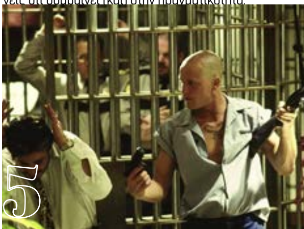
5 Γεννημένοι δολοφόνοι (1994)

Ο Κερκ Ντάγκλας δεν αστειευόταν όταν έλεγε πως θα βοηθήσει τον Ντάλτον Τράμπο και τους υπό διωγμό από το μακαρθικό ρεύμα, καλλιτέχνες και σεναριογράφους. Δύο χρόνια μετά το έπος του «Σπάρτακου», γυρίζει το Lonely are the brave, μια από τις καλύτερες αμερικάνικες ταινίες όλων των εποχών. Ο Τράμπο σκιαγραφεί έναν ασυμβίβαστο με τον καλπασμό του δυτικού πολιτισμού καουμπόι και βάζει δίπλα στον Ντάγκλας, τους Γουόλτερ Ματάου, Τζίνα Ρόουλαντς, Τζορτζ Κένεντι κ.α.