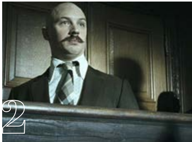
2 Bronson (2006)

Ο Γούντι Χάρελσον είναι ένας ανερχόμενος γιατρός με λεφτά, φήμη, στεγαστικό δάνειο. Όλα αυτά πίσω στο 1996. Για κακή (ή καλή) του τύχη, πέφτει πάνω σε έναν απόκληρο της κοινωνίας, κατάδικο και άγριο τύπο, ο οποίος θα τον βάλει σε μια περιπέτεια που ούτε τη φανταζόταν. Ο Χάρελσον είναι διαχρονικά χαρισματικός, αλλά όταν το σύνολο διευθύνει ο Μάικλ Τσίμινο, τότε ένας λόγος παραπάνω για να δείτε την ταινία.