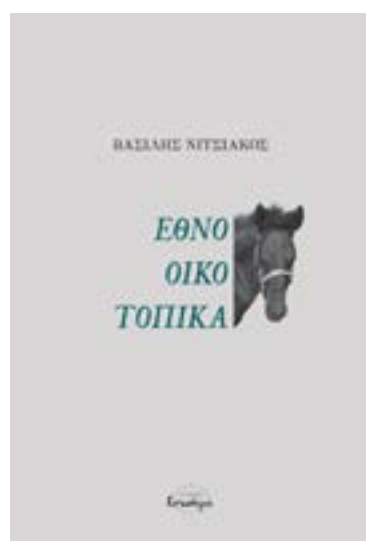
ΕΘΝΟ-ΟΙΚΟ-ΤΟΠΙΚΑ ΒΑΣΙΛΗΣ ΝΙΤΣΙΑΚΟΣ ΙΣΝΑΦΙ

Προδημοσίευση στον «Τύπο Ιωαννίνων» ενός κειμένου από το υπό έκδοση βιβλίο «Εθνο-Οικο-Τοπικά» του Βασίλη Νιτσιάκου, καθηγητή Κοινωνικής Λαογραφίας του Πανεπιστημίου Ιωαννίνων, από τις εκδόσεις «Ισνάφι».