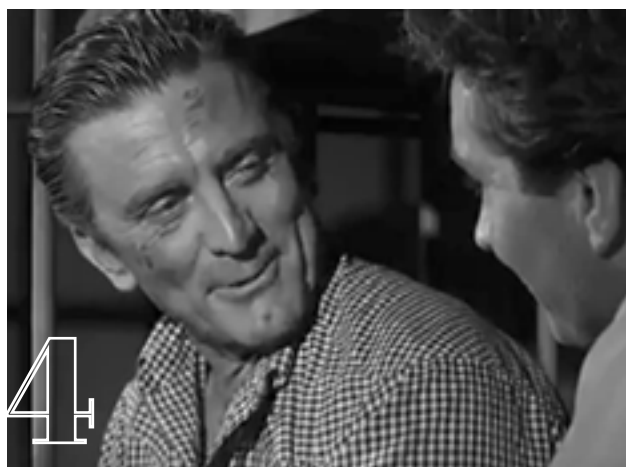
4 Lonely are the brave (1962)