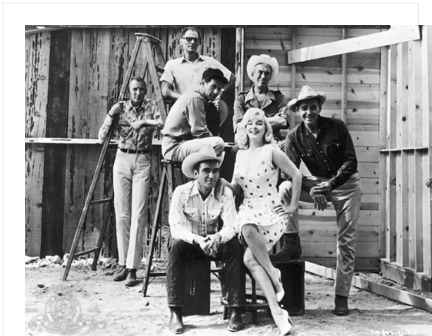
Κλαρκ Γκέιμπλ, Μέριλιν Μονρόε, Μοντγκόμερι Κλιφτ, Τζον Χιούστον, Άρθουρ Μίλερ και Ιλαΐ Γουάλας στους Αταίριαστους

Τα γυρίσματα ταλαιπώρησαν όλους τους συντελεστές, καθώς στη Νεβάδα η θερμοκρασία είχε σκαρφαλώσει στους 42 βαθμούς Κελσίου, αλλά πολύ λιγότερο τον βετεράνο Γκέιμπλ, που έδειξε τον γνωστό επαγγελματισμό ενός ατσάλινου χαρακτήρα, παρότι δεν σταμάτησε ποτέ να πίνει δυο μπουκάλια ουίσκι και να καπνίζει τέσσερα πακέτα τσιγάρα. Αντιθέτως, η Μέριλιν, που κατέφτασε στα πλατό με μια ντουζίνα από προσωπικούς βοηθούς, ράκος από το αλκοόλ και τα υπνωτικά χάπια, θα κατέρρεε, όπως και ο γάμος της με τον Μίλερ, ενώ το νοσηρό σενάριο θα τη φόρτιζε συναισθηματικά ακόμη περισσότερο. Απ' την άλλη, ο Κλιφτ ήταν σε κακό χάλι, όπως συνήθως, λόγω των ψυχολογικών προβλημάτων του, που είχε από νεαρή ηλικία, ενώ η Θέλμα Ρίτερ μπήκε στο νοσοκομείο από υπερκόπωση. Και μέσα σε όλα ο βασιλιάς της ασωτίας και της καλοπέρας Τζον Χιούστον που εγκατέλειπε τα γυρίσματα για να πάει να παίξει το αγαπημένο του