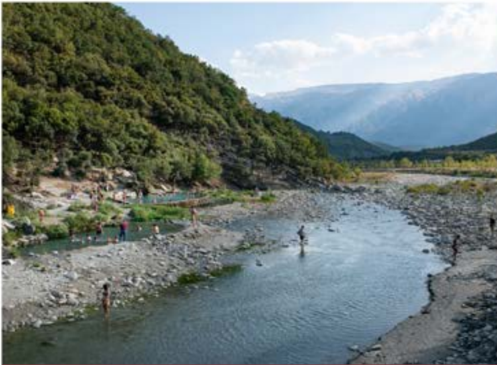
Δίπλα από το πέτρινο γεφύρι του ποταμού Langarice, τα φυσικά θερμά λουτρά αποτελούν δημοφιλή προορισμό.

Ο Langarice είναι παραπόταμος του Vjosa και έχει ήδη τρία μικρές κλίμακας υδροηλεκτρικά έργα στη διαδρομή του, με αποτέλεσμα να έχει μειωθεί η ροή του.