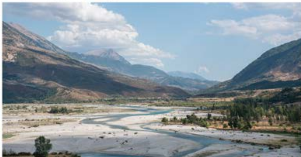
Στάση στη «συνάντηση» του Δρίνου με τη Vjosa, κοντά στο Τεπελέμι. Η πεδιάδα απλώνεται μπροστά μας, με τους ελαιώνες να κάνουν την εμφάνισή τους.