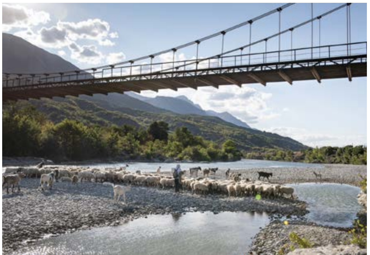
«Τρεις μήνες έχει να βρέξει, το ποτάμι ξερραίνεται. Το ποτάμι είναι πολύ σημαντικό για τα ζώα κι αν γίνουν φράγματα θα στερήσει. Θα είναι καταστροφή και για τους ντόπιους και για τα ζώα και για τους τουρίστες που έρχονται» μας λέει ο Shazan Laskaj, κτηνοτρόφος από το χωριό Çarshovë. Τα 220 αιγοπρόβατά του ποτίζονται καθημερινά στον Vjosa.