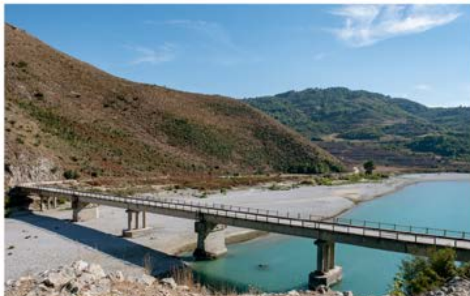
Η γέφυρα του Rocem, που ενώνει τις περιοχές Gjirokastra και Vlore, είναι το σημείο όπου ήταν προγραμματισμένη η κατασκευή ενός ακόμα φράγματος, η οποία έχει προς το παρόν ανασταλεί μετά από δικαστική απόφαση του 2017.