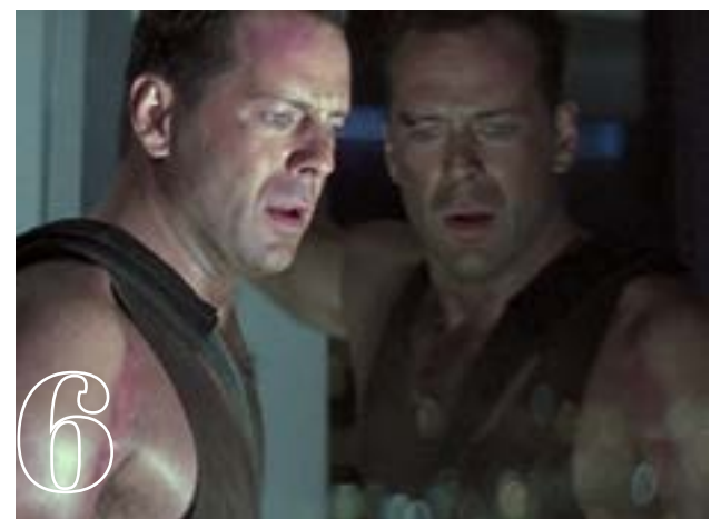
6 Die hard (1988)

Ο Όλιβερ ο Στόουν, σε μια κάπως αλλιώςτική από τις συνηθισμένες του απόπειρες, ξυρίζει γουλί τον Γούντι Χάρελσον before this become real και βάζει δίπλα του την Τζουλιέτ Λιούις, σε ένα έπος απεχθούς βίας και αμερικάνικης ηθογραφίας. Σημειωτέον ότι το σενάριο είναι του Ταραντίνο και ότι παίζουν επίσης οι Ρόμπερτ Ντάουνι τζ. Και Τζάρεντ Χάρις, σε ανύποπτους ρόλους.