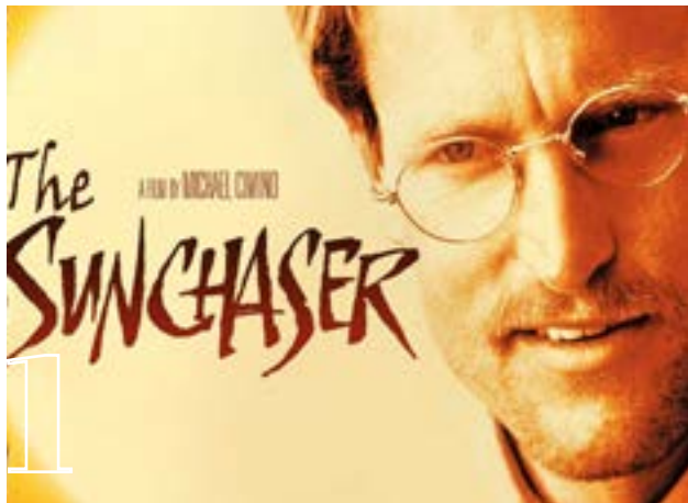
1 Sunchaser (1996)

Αν βαρεθήκατε τις πολύ christmassy ταινίες και προτιμάτε κάτι λιγότερο εορταστικό, ιδού πέντε προτάσεις με αντισυμβατικούς ήρωες, που ζούνε κάπως διαφορετικά τη ζωή τους