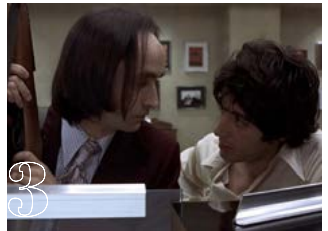
3 Σκυλισια μέρα (1975)

Το 2008 ο Θεούλης Τομ Χάρντι ενσαρκώνει τον Μπρόνσον, έναν τύπο που μπήκε 7 χρόνια φυλακή γιατί έκλεψε ένα ταχυδρομικό γραφείο. Τελικά η ποιή του εκτείνεται και αυτός αποφασίζει ότι θα γίνει όντως το πρότυπό του: Ο Τσαρλς Μπρόνσον. Η ταινία του Νικόλας Γουάντινγκ Ρεφν «συστήνει» τον Χάρντι, λίγο πριν αυτός γίνεται ο υπεραστέρας που ξέρουμε σήμερα, στο ρόλο του υπαρκτού προσώπου (ναι, υπάρχει...), του Μάικλ Πέτερσον. Ο Πέτερσον το 1987 πήρε και επίσημα το όνομα του ειδώλου του, όταν αποφάσισε να είναι και στην ταυτότητα... Μπρόνσον. Ο Χάρντι τον υποδύεται με μοναδικό τρόπο, σε μια κλειστοφοβική ταινία, που δύσκολα πιστεύει κανείς ότι συμβαίνει (και) στην πραγματικότητα.