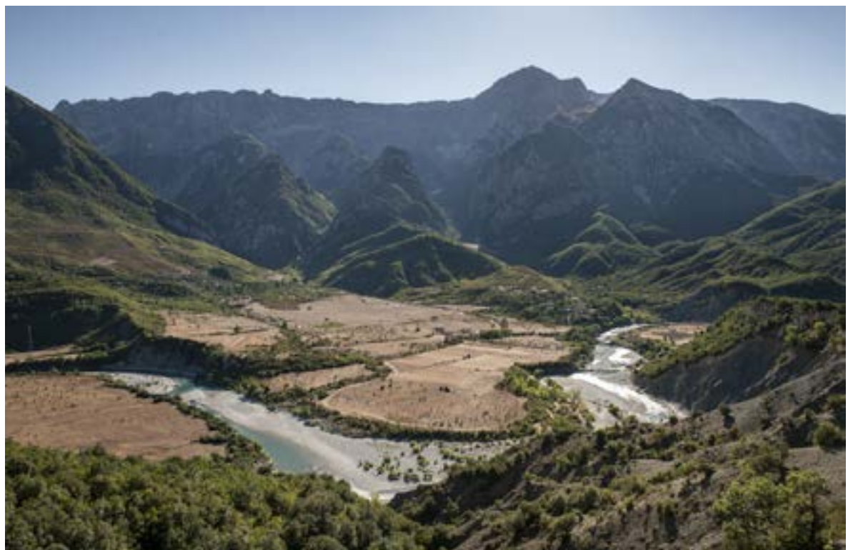
Περνώντας τα αλβανικά σύνορα το τοπίο αλλάζει χαρακτηριστικά. Στο δρόμο προς Πρεμετή, στα αριστερά μας το ποτάμι και οι ψηλές κορυφές της Νεμέρτικας.