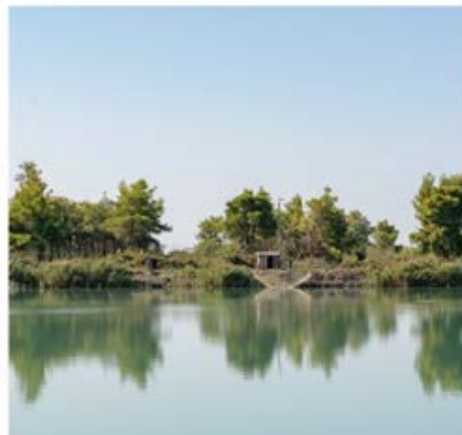
Κοντά στο δέλτα του ποταμού Vjosa. Ψάρεμα με δίκτυα που λέγονται bilanche, σταθερές κατασκευές με τροχαλίες που βυθίζονται και σηκώνουν μεγάλα τετράγωνα δίκτυα κοντά στις όχθες του ποταμού. Το τοπίο είναι πλέον εντελώς επίπεδο, με χαμηλή βλάστηση και άμμο. Δεν υπάρχει συγκεκριμένος δρόμος και σήμανση που να οδηγεί στο ποτάμι. Η απόσταση από όχθη σε όχθη είναι περίπου 150μ.