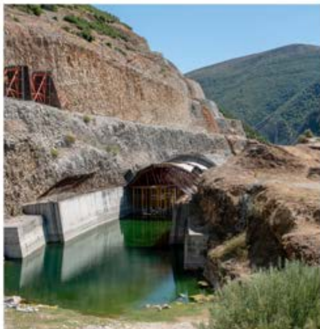
Στο Καλίνας... Εκεί που δόθηκε μία από τις σημαντικές μάχες του περιβαλλοντικού κινήματος για να σταματήσει ένα μεγάλο υδροηλεκτρικό έργο. Το παλιό εργοτάξιο δηλώνει το παρών.