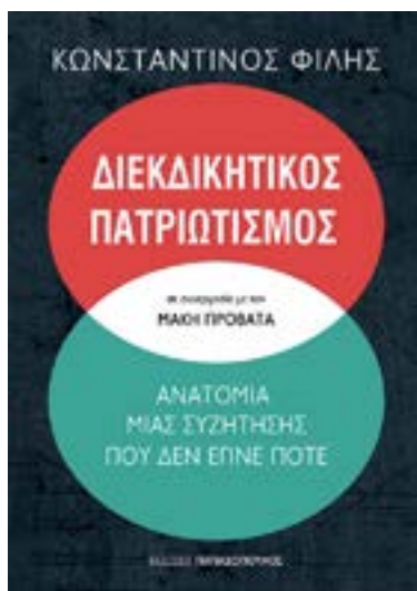
ΔΙΕΚΔΙΚΗΤΙΚΟΣ ΠΑΤΡΙΩΤΙΣΜΟΣ ΑΝΑΤΟΜΙΑ ΜΙΑΣ ΣΥΖΗΤΗΣΗΣ ΠΟΥ ΔΕΝ ΕΓΙΝΕ ΠΟΤΕ Κωνσταντίνος Φίλης, σε συνεργασία με τον Μάκη Προβατά (εκδόσεις Παπαδόπουλος)

Τ ο διεθνές δίκαιο δεν είναι σημαία ευκαιρίας, η Ελλάδα το γνωρίζει καλά και οφείλει να πιέσει την Τουρκία προς την κατεύθυνση του σεβασμού και της εφαρμογής του. Αυτή είναι μια από τις βασικές θέσεις του Κωνσταντίνου Φίλη στο βιβλίο του «Διεκδικητικός πατριωτισμός», που κυκλοφορεί από τις εκδόσεις Παπαδόπουλος. Στη συζήτησή του με τον Μάκη Προβατά, «μια συζήτηση που δεν έγινε ποτέ», όπως χαρακτηριστικά αναφέρεται στον υπότιτλο, ο Κωνστ. Φίλης, διευθυντής ΙGA, αναπληρωτής καθηγητής του Αμερικανικού Κολλεγίου Ελλάδας και αναλυτής διεθνών θεμάτων του τηλεοπτικού σταθμού «Ant1», αναπτύσσει την έννοια του «διεκδικητικού και ορθολογικού πατριωτισμού» ως διπλωματικού μέσου και μετώπου της Ελλάδας για την προώθηση της παρουσίας της στον σύγχρονο κόσμο.