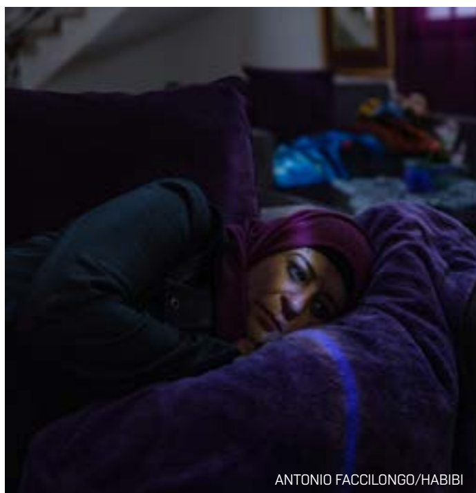
ANTONIO FACCILOGO / HABIBI