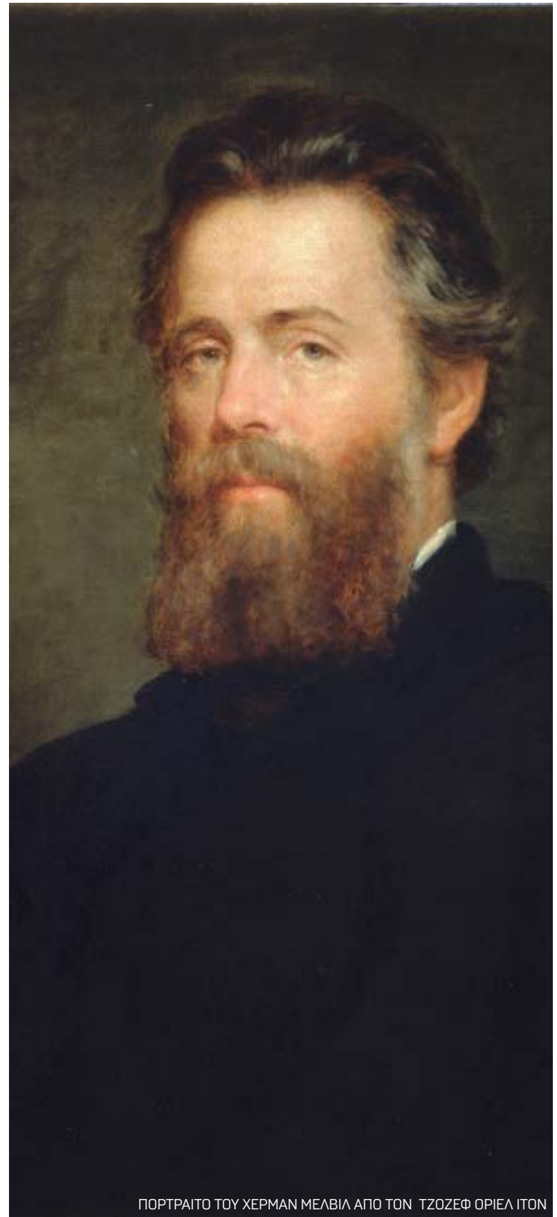
ΠΟΡΤΡΑΙΤΟ ΤΟΥ ΧΕΡΜΑΝ ΜΕΛΒΙΛ ΑΠΟ ΤΟΝ ΤΖΟΖΕΦ ΟΡΙΕΛ ΙΤΟΝ

Με ένα φαινομενικά ψυχρό τρόπο, ο Μέλβιλ περιγράφει πως ο καλύτερος ναύτης του αγγλικού στόλου οδηγείται νομοτελειακά προς μια κατεύθυνση, όπως την καθορίζουν οι συνιστώσες της εξουσίας, της κοινωνικής αποδοχής (ή απόρριψης) και του χρέους και της υποταγής. Μια ανάγνωση του «Μπίλι Μπαντ» λέει ότι η έννοια της χειραφέτησης χάνει υπό το βάρος των νομοτελειακά καθορισμένων πραγμάτων και σχέσεων, ωστόσο η δυναμική του βιβλίου είναι (και) αυτή: ότι επιτρέπει διαφορετικές αναγνώσεις και την ανάπτυξη μιας διαλεκτικής γύρω από τα νοήματά του.