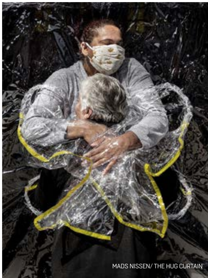
MADS NISSEN / THE HUG CURTAIN

Μ ια στιγμή ελπίδας και αγάπης στην ταραγμένη εποχή του κορονοϊού σ' ένα γηροκομείο της Βραζιλίας. Το χρονικό μιας ερωτικής ιστορίας κρατούμενου στις φυλακές του Ισραήλ στα επισκεπτήρια της συζύγου του. Μια μητέρα με το μωρό της σε αυτοσχέδια πλαστική τέντα στις λάσπες της Ειδομένης. Καρέ δυνατά, ιστορίες που συγκλονίζουν, καταγραφές σαν εργαλεία μνήμης από φωτορεπόρτερ διεθνών πρακτορείων. Διακρίθηκαν στον παγκόσμιο ετήσιο διαγωνισμό φωτορεπορτάζ και ντοκουμέντου World Press Photo 2021 και παρουσιάζονται